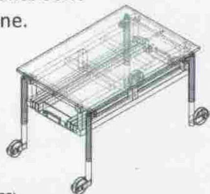
domanda di brevetto depositata -inventore: gian luca piazza architetto (MI 14305)